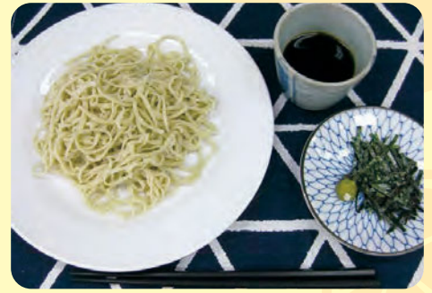
昨年の「手打ちそば教室」の様子と出来上がった蕎麦