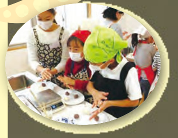
▲前回のエビちゃん食育隊で開催した「和菓子を作ろう」の様子