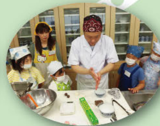
▲5月のエビちゃん食育隊で開催した「季節の和菓子を作ろう!!」の様子