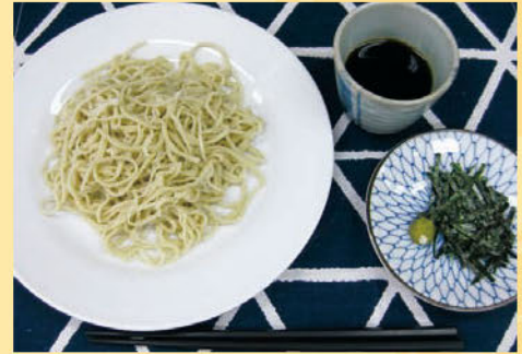
昨年の「手打ちそば教室」の様子と出来上がった蕎麦