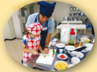
▲前回のエビちゃん食育隊で開催した「美味しいお茶の入れ方とお茶そばろ井」の様子